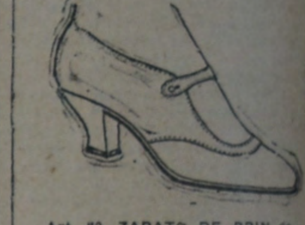
Art. 89. ZAPATOS de cabritilla. Cordero. Taca bajo como el modelo y de una tira. para entrecana. Ocasión. Nos. 24 al 41 a $ 4.90.