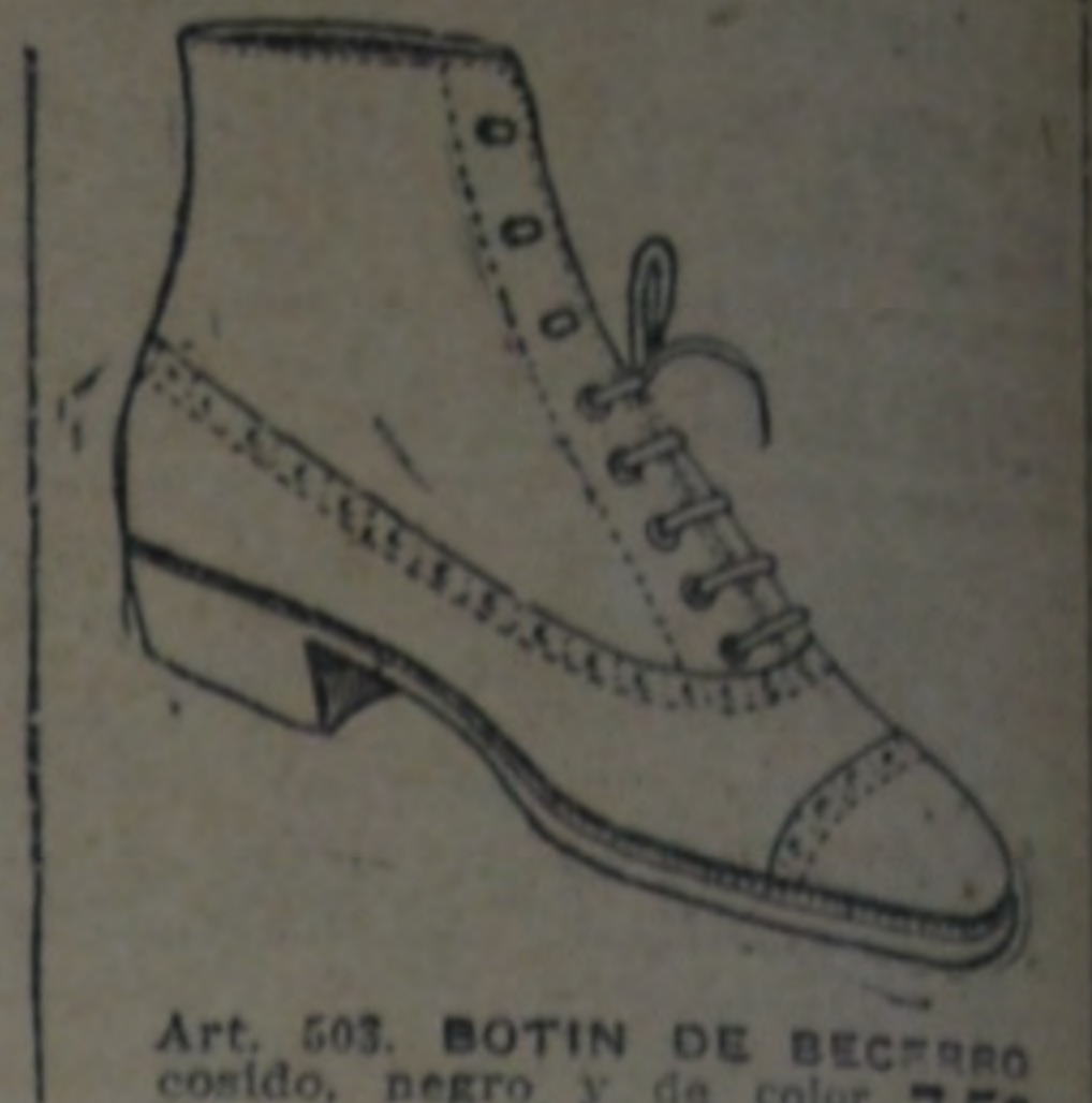
Art. 503. BOTIN DE BECERO. Cordero, negro y de color. Nos. 33 al 45 a $ 7.50.